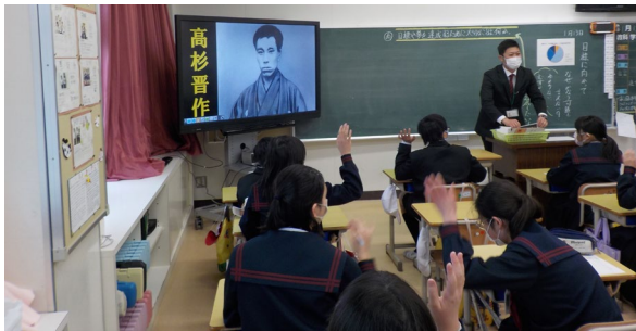
晋作の生き方から何を学ぶか